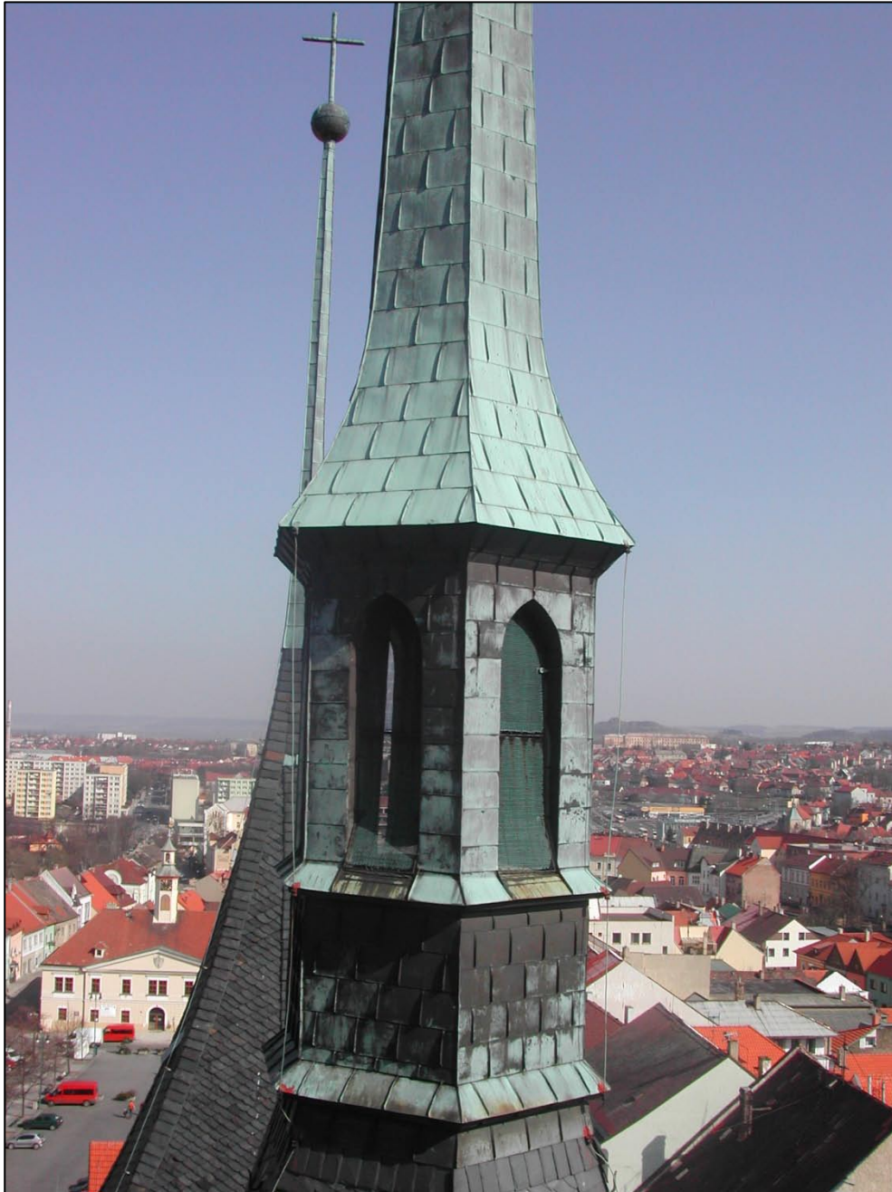
Vue du clocher de l'église saint Nicholas

Nous avons aussi visité une église Renaissance, nommée église saint Nicholas, une magnifique église comportant un immense clocher, qui donne vue sur la ville entière, ainsi que sur la campagne aux alentours, et un musée d'art moderne. En fin de compte, l'ambiance générale de la ville nous a beaucoup plu, une ville très colorée et accueillante.