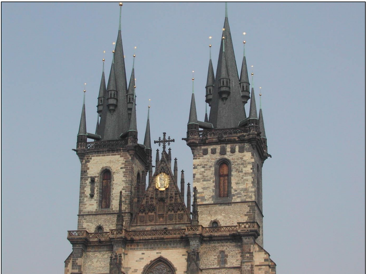
Les tours de la cathédrale Saint-Guy, située dans l'enceinte du château de Prague

Dans la ville de Prague, il faisait une chaleur étouffante une chaleur à laquelle nous ne nous attendions pas dans ce pays où nous pensions qu'il faisait plus frais qu'en France.