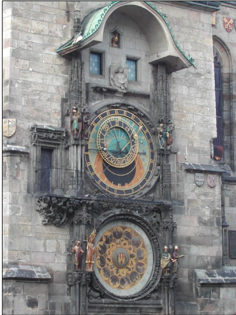
L'horloge astronomique de Prague