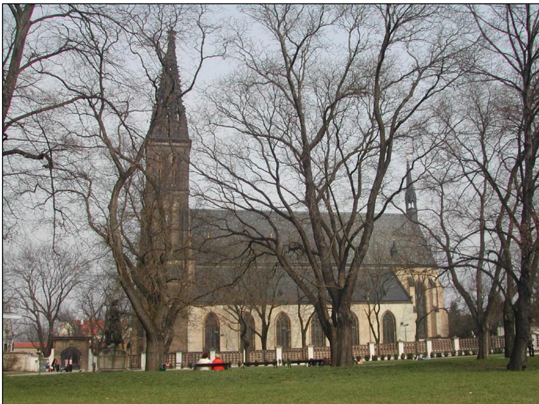
Le quartier de Vysehrad à Prague : vue de l'église