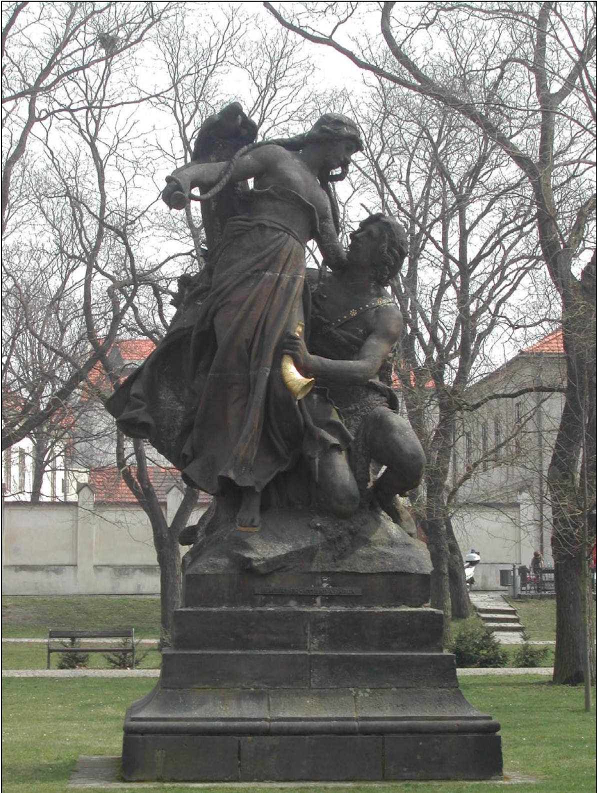
Statue dans un jardin de Vysehrad