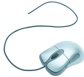
Légende décrivant l'image ou le graphisme

être utilisé pour votre site Web. Microsoft Publisher vous offre un moyen simple de convertir votre bulletin en site Web. Une fois votre bulletin terminé, vous n'aurez plus qu'à le convertir en site Web et à le publier.