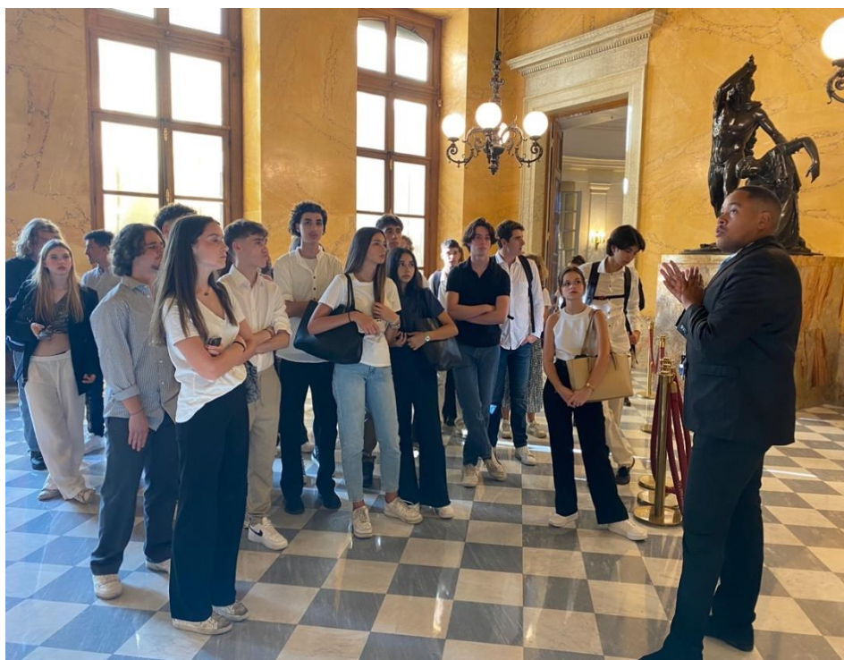
Notre guide ..

En sortant de l'hémicycle, notre guide a tenu à nous interpeller sur un des moments essentiels de notre démocratie en nous montrant un tableau représentant le vote au moment de l'abolition de la peine de mort en 1981..