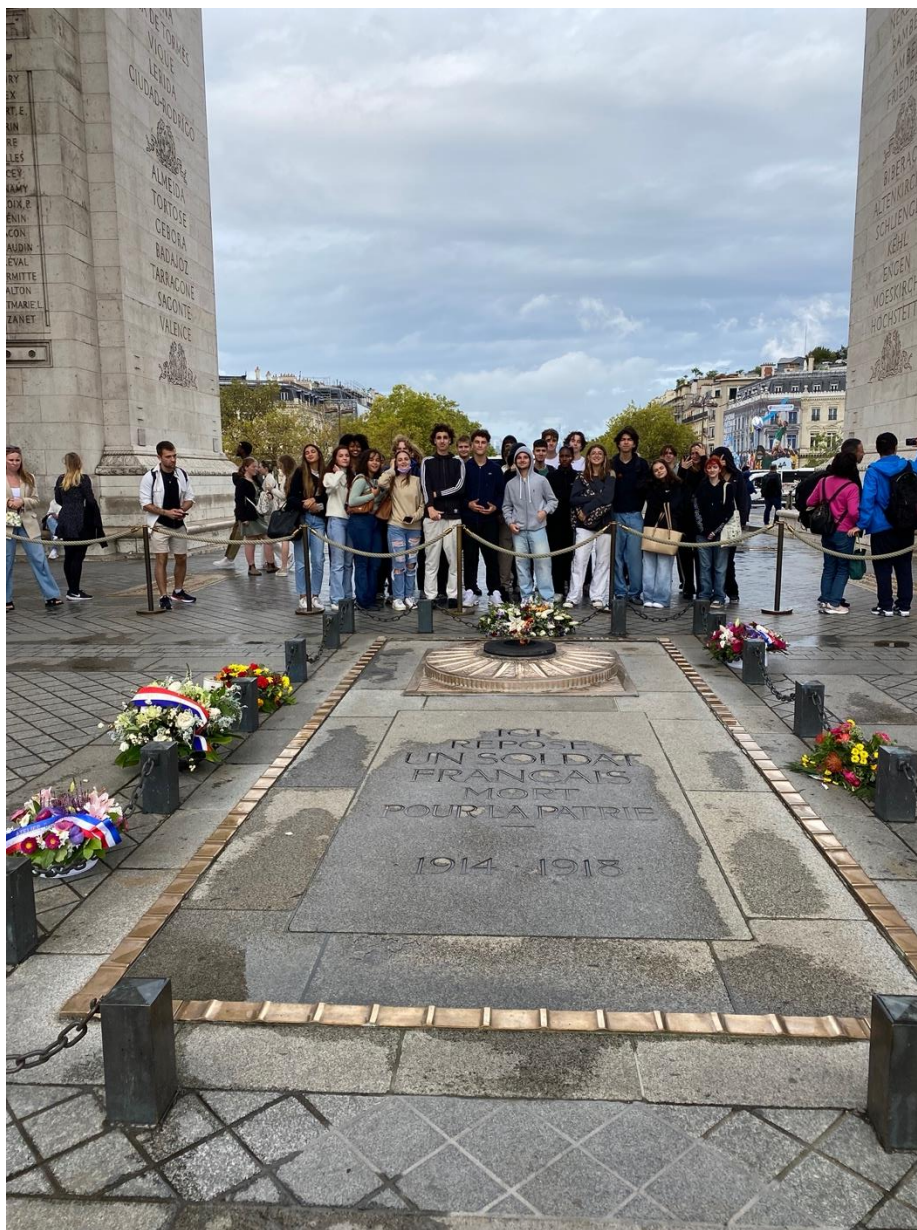
Tombe du soldat inconnu

En redescendant, nous nous sommes recueillis devant la tombe du soldat inconnu qui rend hommage aux 1,5 millions de Français morts pour la France durant la 1ère guerre mondiale. Au centre du tombeau, une flamme symbolisant le souvenir brille depuis le 11 novembre 1923.