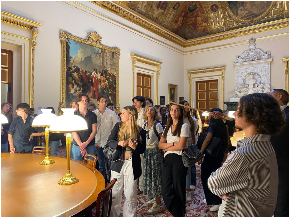
... un autre salon également