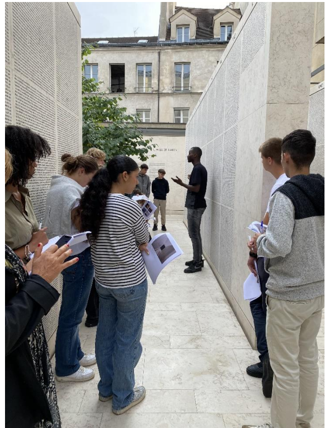
Le « mur des noms »

Un atelier nous a ensuite été proposé sur le thème de « génocides et lieux de mémoire » : cela a été l'occasion d'approfondir la notion de génocide à travers l'évocation d'autres génocides comme ceux arménien et rwandais. Nous avons pu également réfléchir sur les conflits mémoriels en comparant par exemple 2 mémoriaux, celui d'Erevan, en Arménie, et celui, turc, d'Igdir.