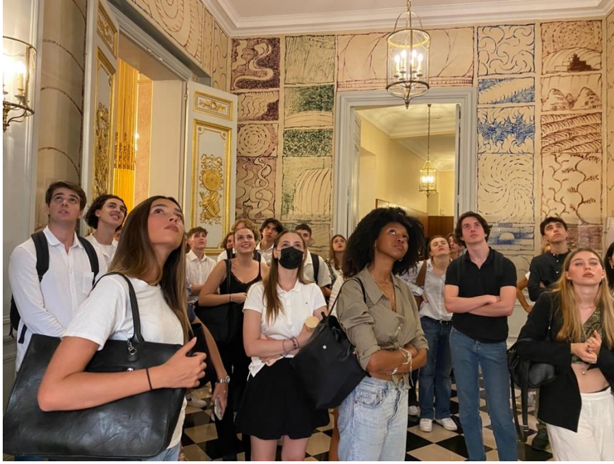
... Nous fait découvrir une salle richement décorée...