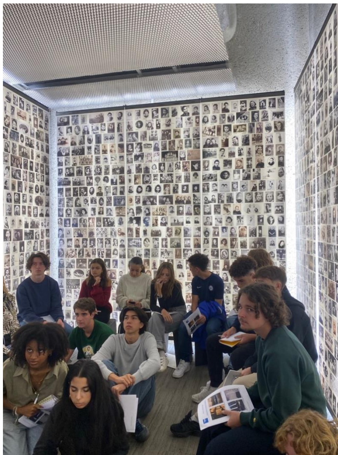
Le « mémorial des enfants »

Nous avons été particulièrement touchés également par le mémorial des enfants avec les photos de chaque enfant déporté. On compte plus de 7000 mineurs déportés. Très peu échapperont à la mort. « Je me rappelle que pour certains enfants, leur photo était une photo de classe : je me suis sentie davantage proche d’eux car nous aussi, aujourd’hui, nous prenons des photos de classe. Beaucoup étaient souriants ou faisaient des choses qu’ils aimaient faire. C’est tellement triste de savoir qu’ils avaient leur vie devant eux » Ce lieu permet de mettre un visage à un nom. Il permet d’affirmer la singularité de chaque enfant : ce ne sont pas 7 000 morts mais 7 000 personnes.