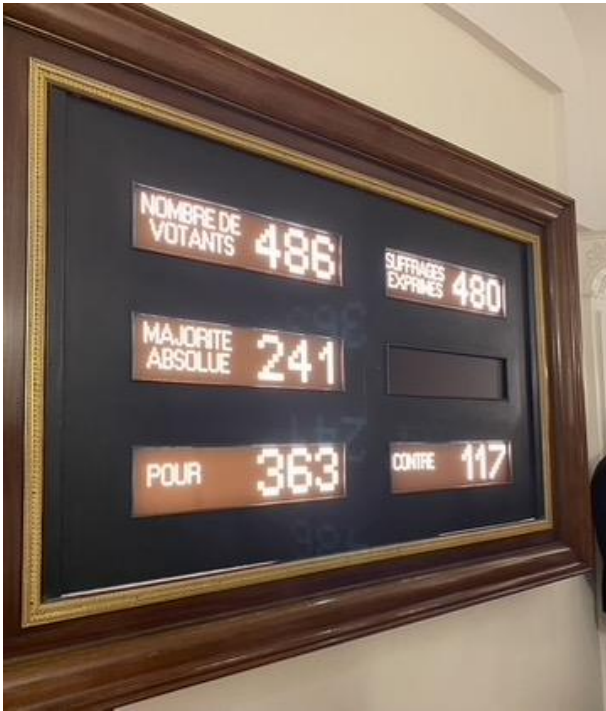
Tableau représentant le résultat des votes pour l'abolition de la peine de mort en 1981