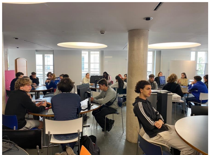
L'atelier sur le thème de « génocides et lieux de mémoire »

Un atelier nous a ensuite été proposé sur le thème de « génocides et lieux de mémoire » : cela a été l'occasion d'approfondir la notion de génocide à travers l'évocation d'autres génocides comme ceux arménien et rwandais. Nous avons pu également réfléchir sur les conflits mémoriels en comparant par exemple 2 mémoriaux, celui d'Erevan, en Arménie, et celui, turc, d'Igdir.