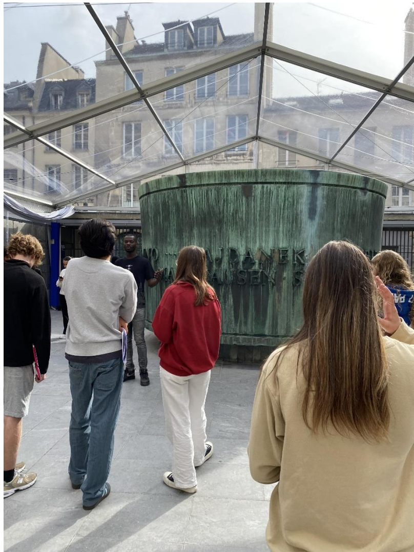
La sculpture en forme de cylindre vert