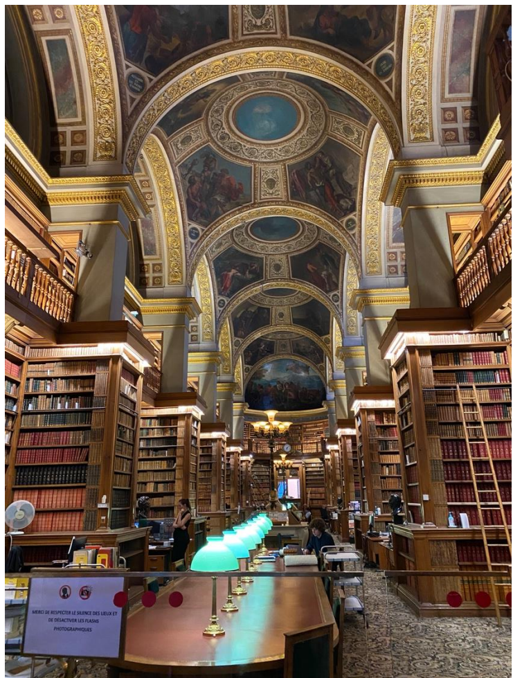
La bibliothèque de l'Assemblée nationale