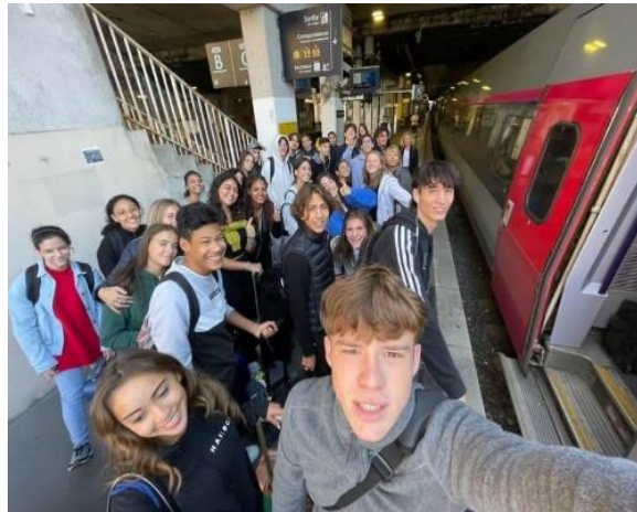
Départ Montpellier St Roch !