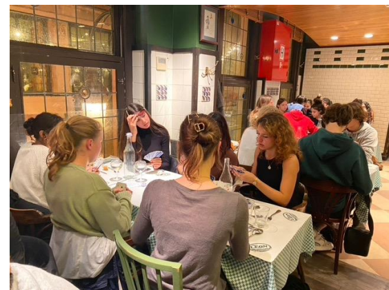
Moment de détente au restaurant, Léon de Bruxelles