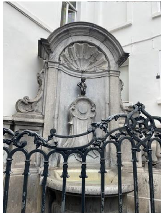
Le Manneken Pis

Après un voyage de 6 heures à bord du Thalys et notre installation en auberge de jeunesse, nous avons découvert le centre-ville de Bruxelles et notamment la Grand-place avec ses bâtiments ornés de feuilles d'or. Le lendemain, lors d'une visite guidée du centre historique de Bruxelles, nous avons appris que la capitale belge, autrefois entourée de remparts, était parcourue par une rivière, la « Senne ». Les guides nous ont également montré comment reconnaître, autour de la Grand Place, les maisons de commerce grâce aux symboles ornant chacune d'entre elles et correspondant à un corps de métier.