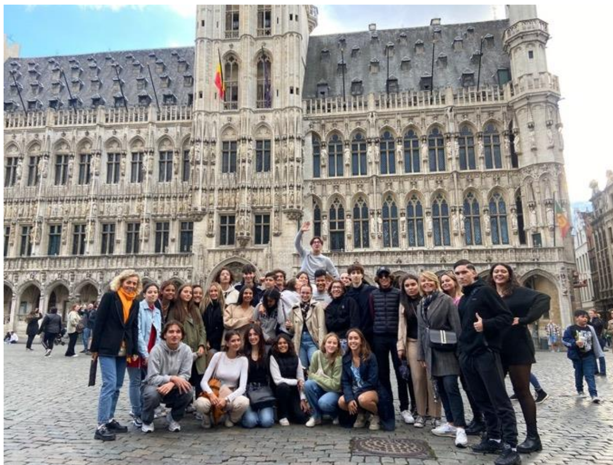
La Grand-Place, cœur de Bruxelles