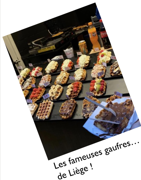
Les fameuses gaufres... de Liège !