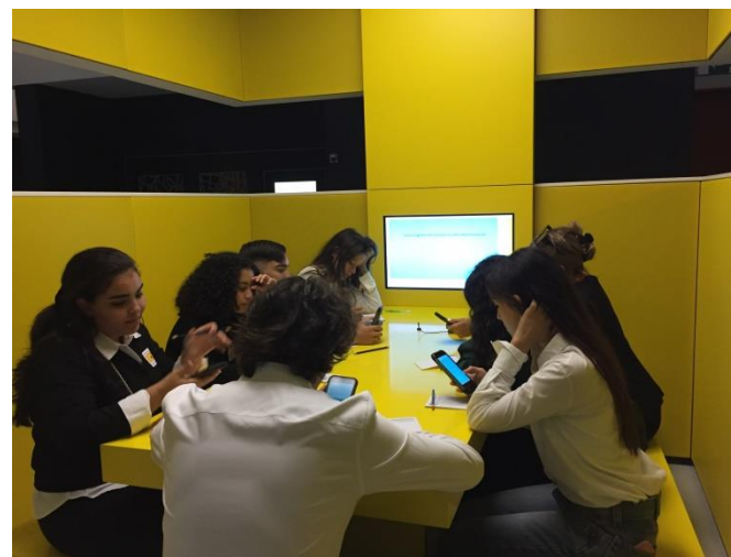
Jeu de rôle au Parlement européen