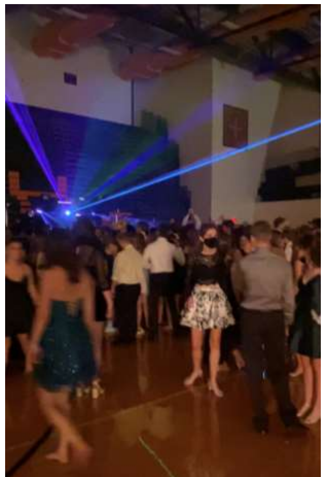
"Homecoming" de ma high school