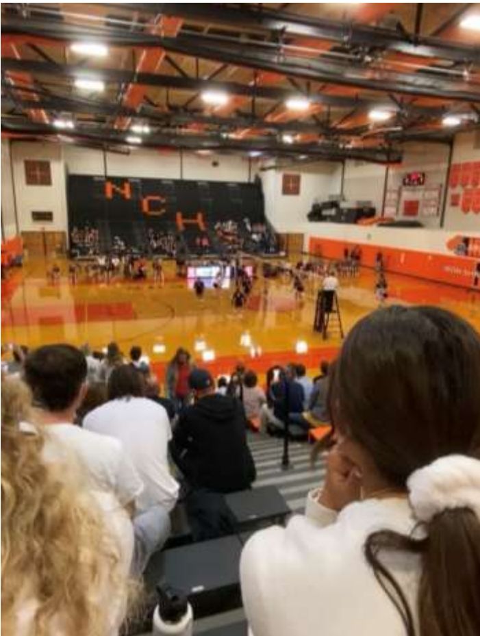
Le gymnase de ma high school (où se jouent les matchs de volley et basket)