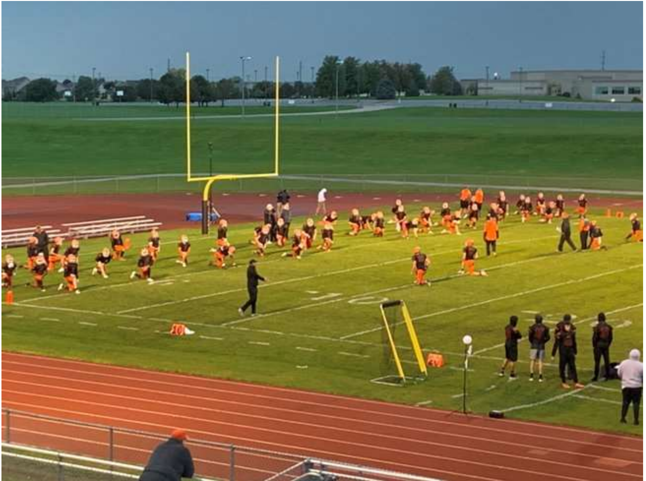
L'équipe de football américain qui s'échauffe pour le match sur le terrain de notre high school