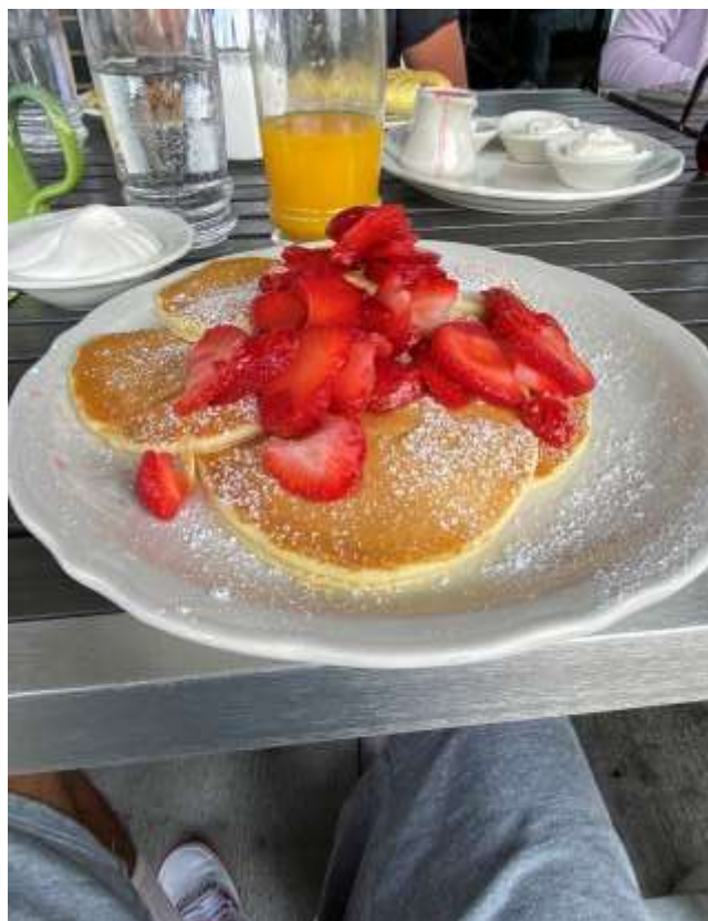
Strawberry pancakes pour le petit-déjeuner