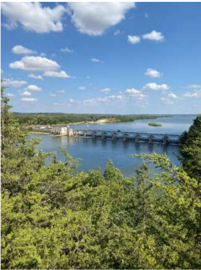
Starved Rock Park, Illinois