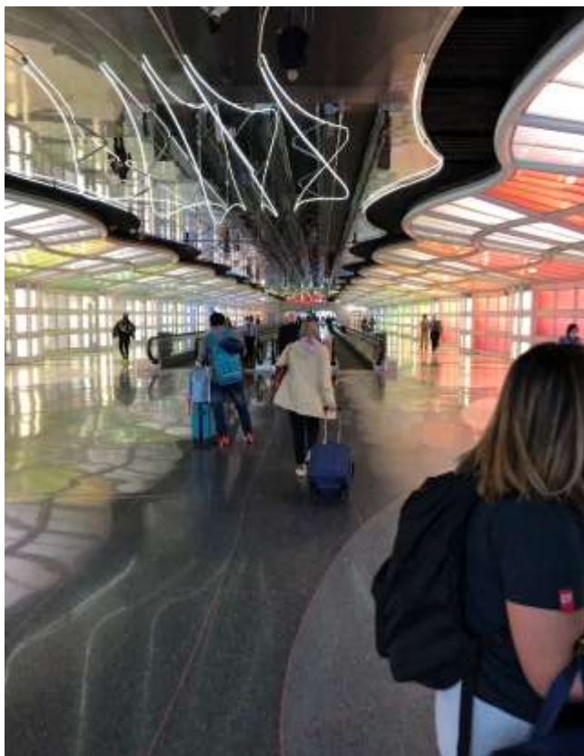
L'aéroport de Chicago, Illinois