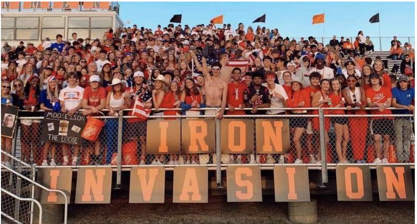
Notre section étudiants dans les gradins pour les matches de football américain à domicile