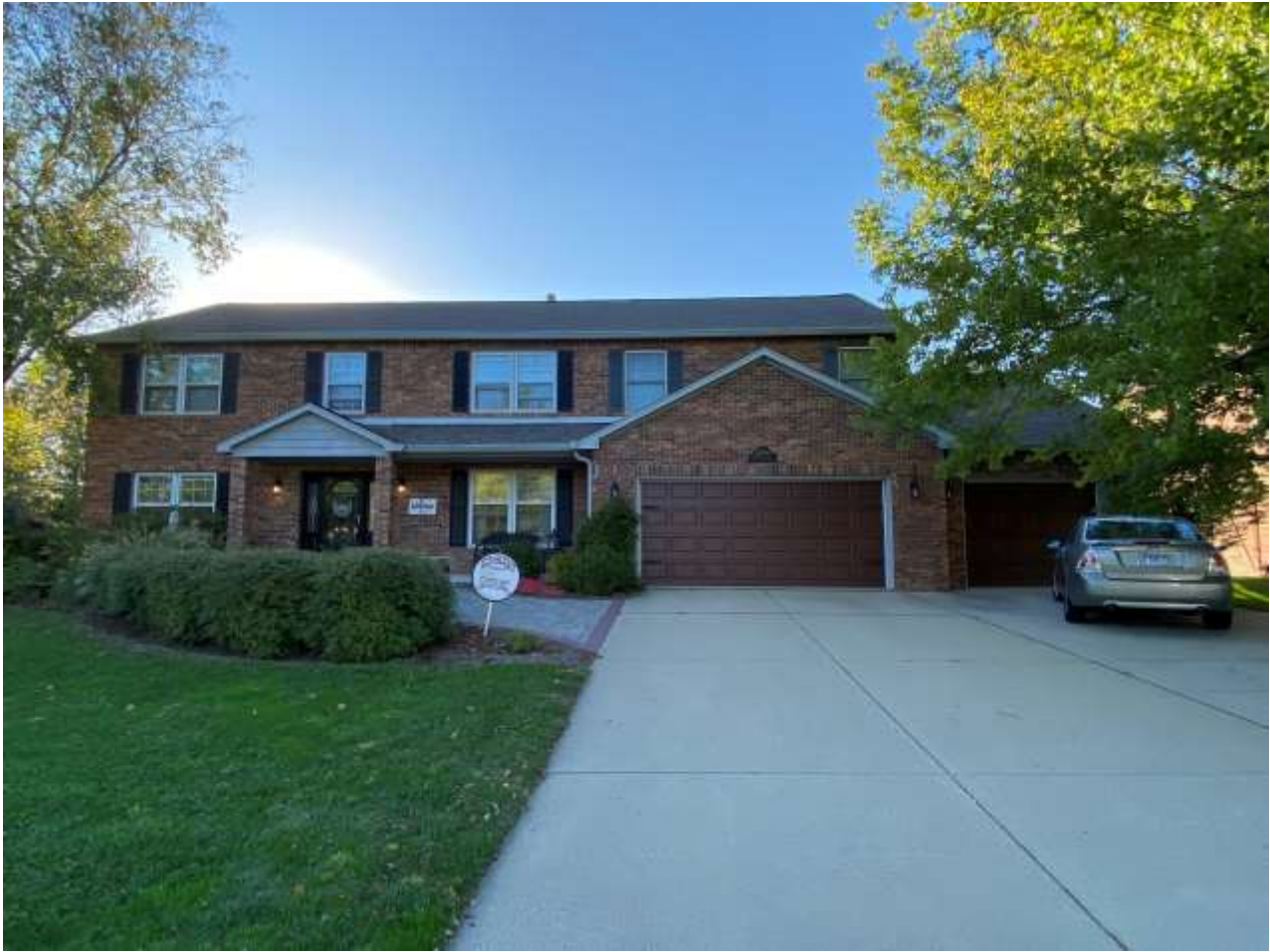
La maison où j'habite !