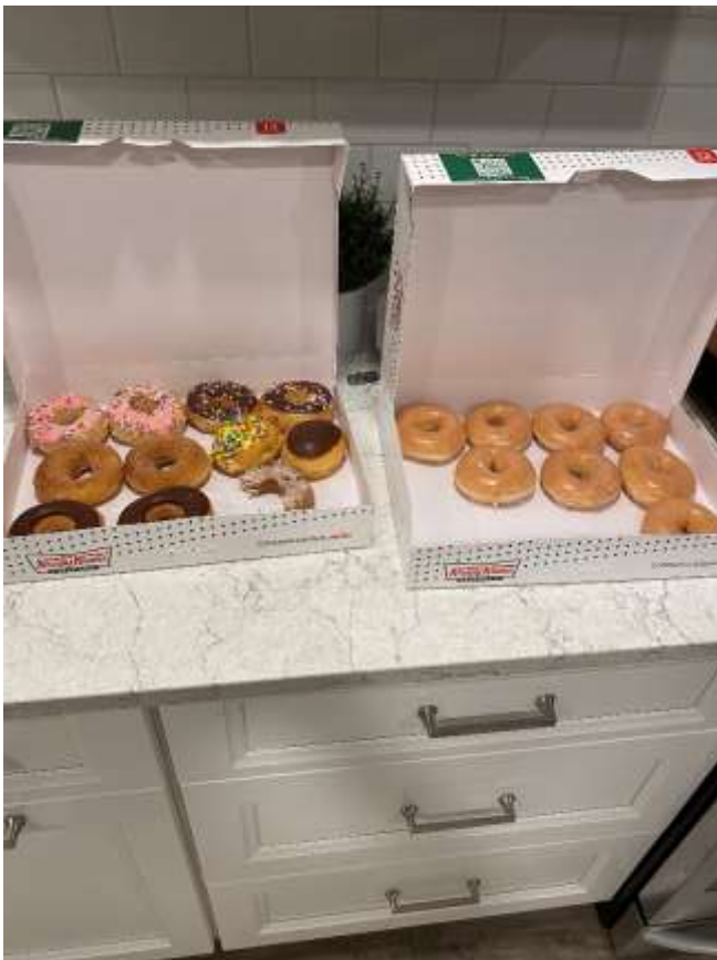
Des donuts de chez Krispy Kreme