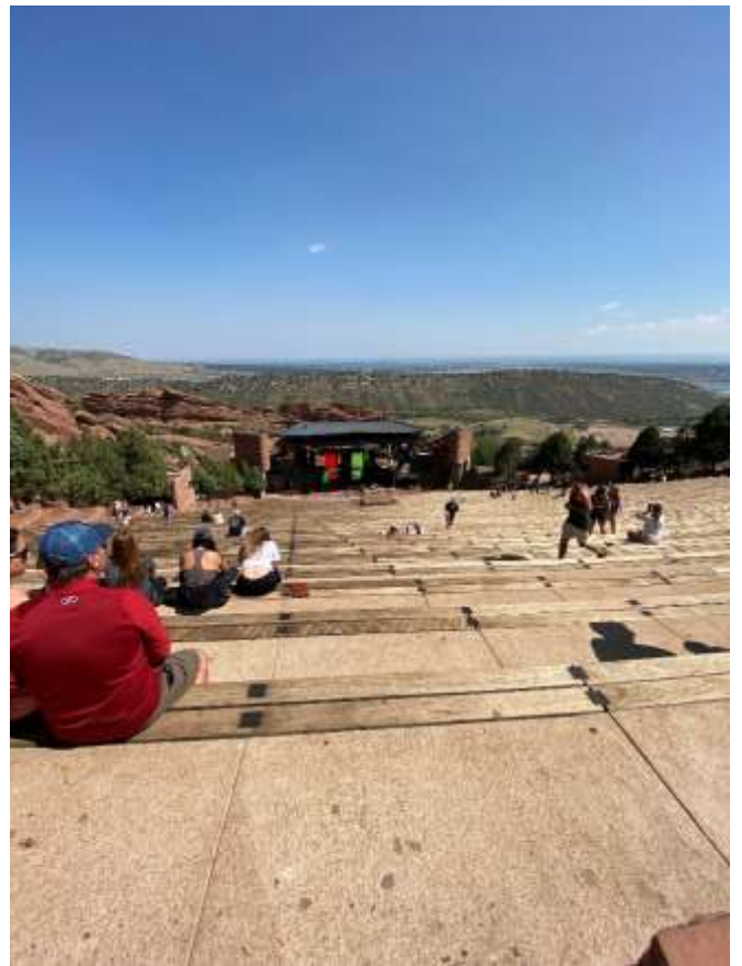
Le "Red Rocks Amphitheater" (Denver)